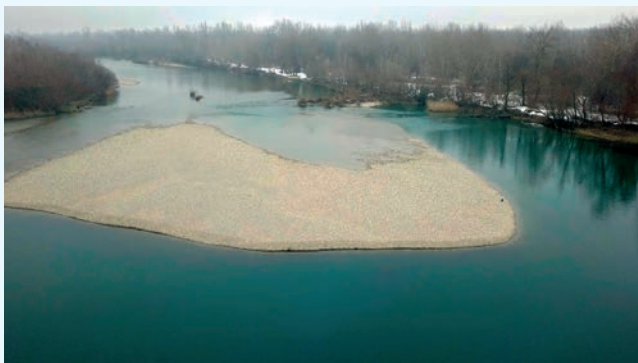
Drava, Beli kipi kod Varaždina

Obilazak je predviđen unutar tri kilometra toka rijeke od rkm 288 do rkm 291, a vrijeme obilaska je 3 sata.