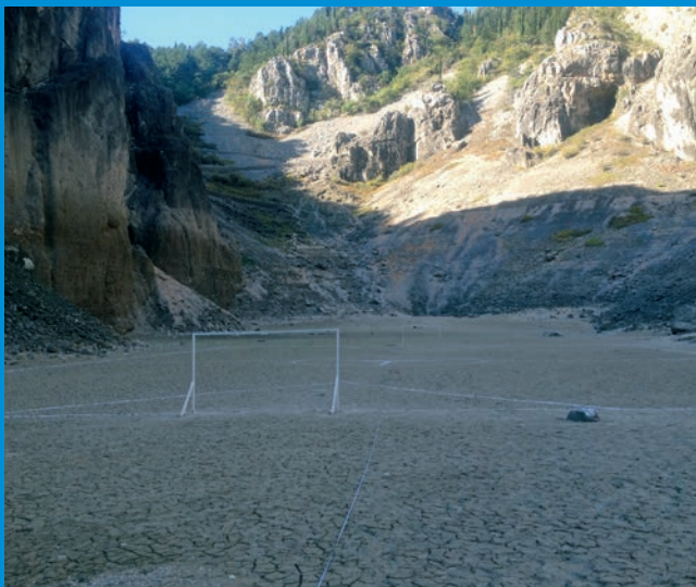
Nanos na dnu Modrog jezera

Skup se održava u Varaždinu, na području sliva Drave, s kojom su sam grad i stanovnici iznimno povezani. Radi se o prostoru s vrlo velikom bioraznolikošću kojoj pridonosi i riječna morfologija uveliko povezana s procesima pronosa i taloženja nanosa.